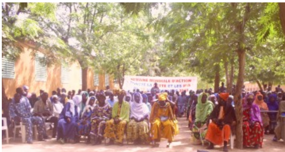
Conférence populaire paysanne à Nossombougou dans la cour de l'école fondamentale "A"

Ces activités visaient à informer et sensibiliser la presse, les universitaires et les paysans sur les effets pervers des politiques néolibérales de la Banque Mondiale et du Fonds Monétaire international