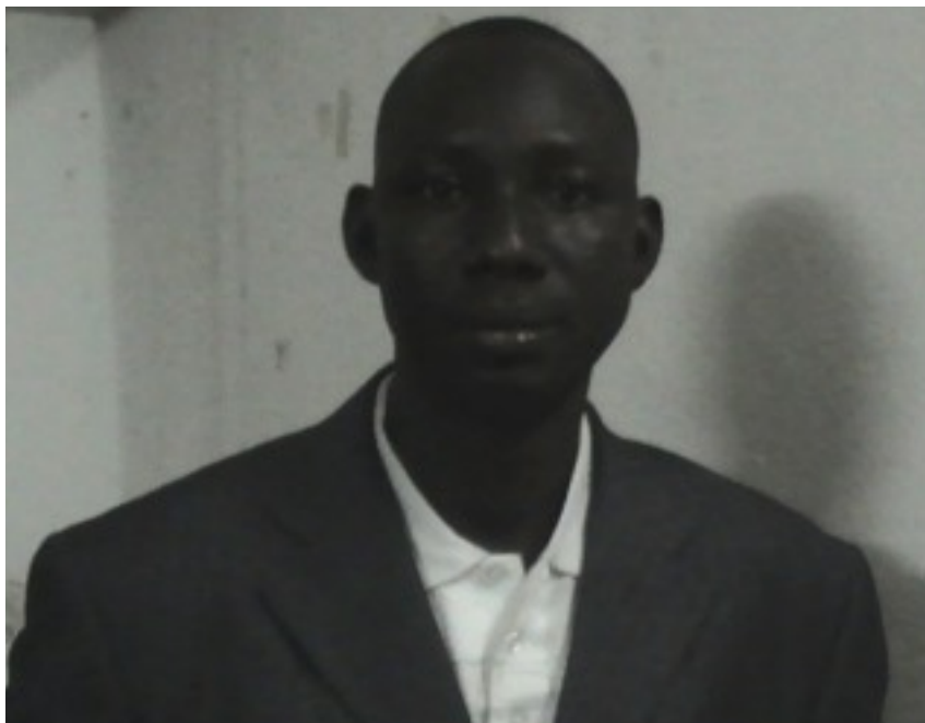
Président de l'Organisation Focale de Koulikoro

MP: En tant que membre de la société civile, quelle est votre impression sur l'initiative de l'ONSC/Santé ?