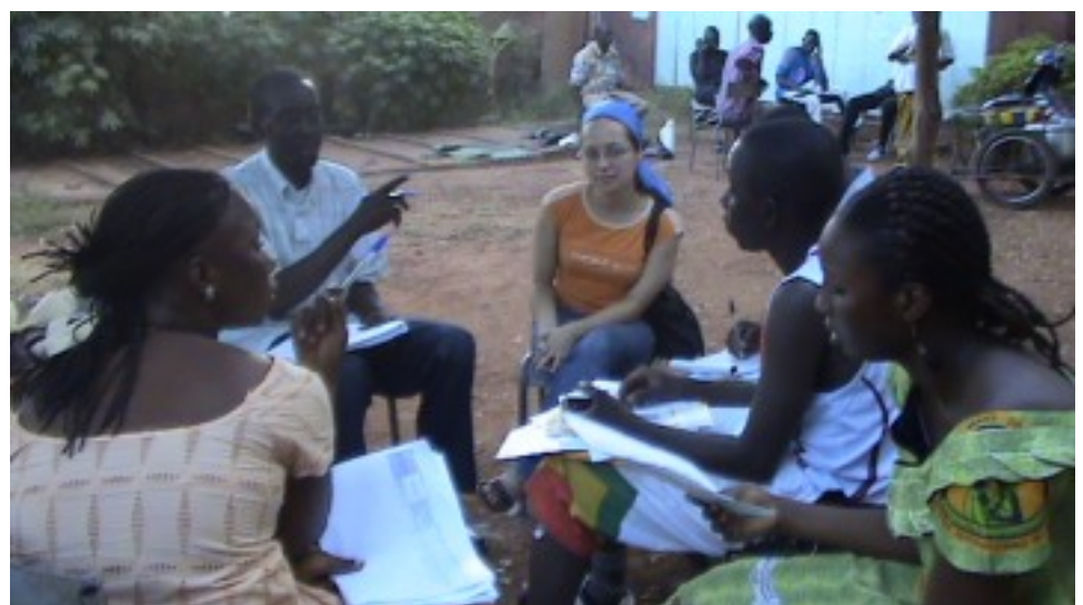
Réunion CSB Commune VI à la Mairie de Banankabougou

Les réunions se sont déroulées du 15 au 17 octobre 2008 avec les six