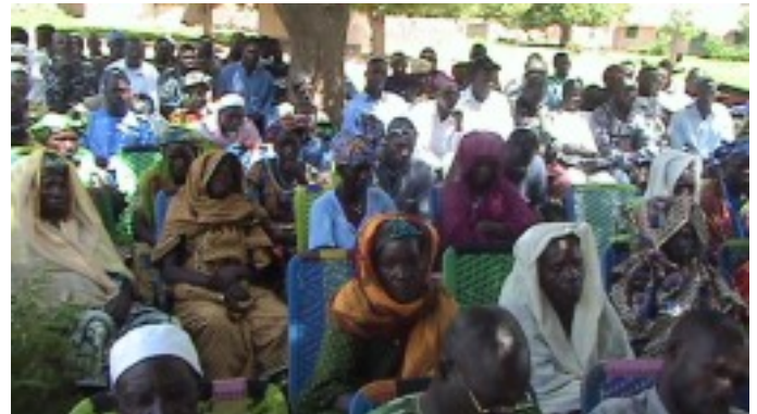
Mobilisation citoyenne à la Base dans la commune rurale de Safo à l'école fondamentale Second Cycle

réglementation en vigueur ; des assemblées populaires villageoises, des rencontres d'intercommunalités, des interpellations à l'échelle communautaire et des actions de plaidoyer en faveur de la scolarisation des filles.